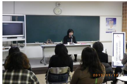
11月開催 弁護士による研修

http://www.shien.or.jp/pdf/meisai_jka.pdf