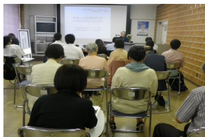
6月開催 精神科医による研修